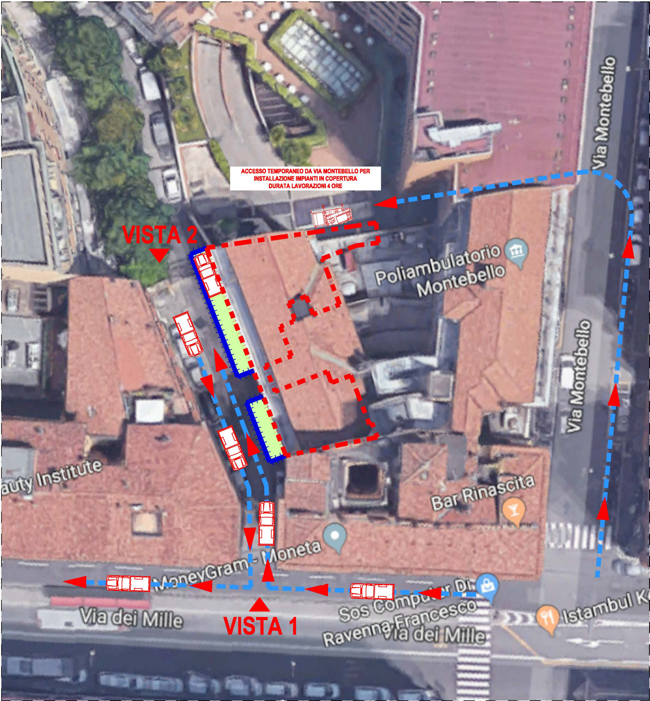
LAYOUT DI CANTIERE PLANIMETRIA